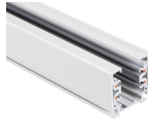
33233 TEAR N TR 2M-B

Elemento di sistema a sbarra, TEAR N TR 2M-W, 3 circuiti, bianco, (33232)