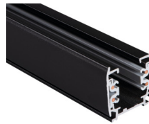
33232 TEAR N TR 2M-W

Elemento di sistema a sbarra, TEAR N TR 2M-W, 3 circuiti, bianco, (33232)